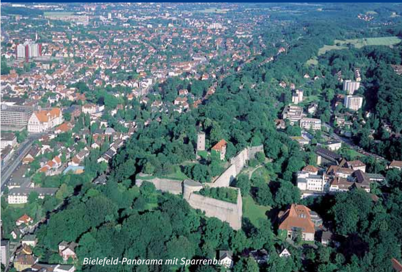
Bielefeld-Panorama mit Sparrenburg