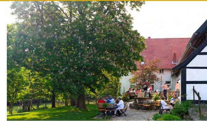
Bauernhofcafé im Ravensberger Hügelland.