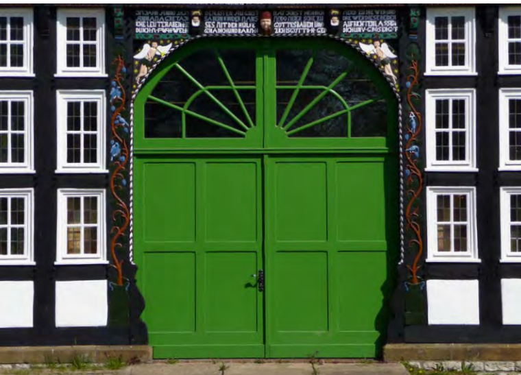
Hof in Jöllenbeck.

Der rund 48 km lange Radwanderweg führt Sie überwiegend über autoarme Straßen und Grünanlagen durch das Ravensberger Hügelland zwischen Herford und Bielefeld. Namensgeber der Radroute sind die geschnitzten Engel, die sich an den Torbögen vieler Bauernhöfe finden lassen. Die Engelroute eignet sich als ausgedehnte Feierabendrunde genau so wie als Sonntagsausflug für die ganze Familie. Zahlreiche Einkehrmöglichkeiten und Spielplätze an der Strecke laden zu einer Pause ein. Naturliebhaber und Erholungssuchende kommen durch Naturschutzgebiete und ausgedehnte Grünzüge auf ihre Kosten.