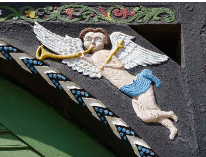
Engel in Niederdornberg.

Beschaffenheit: Nebenstraßen mit wenig Verkehr, Radwege