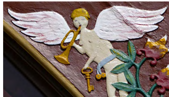
Engel in Oldinghausen.

Fahren Sie auf der Engelroute durch das Ravensberger Hügelland und entdecken Sie 23 dieser eindrucksvollen Höfe!