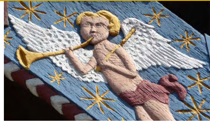
Engel in Theesen.