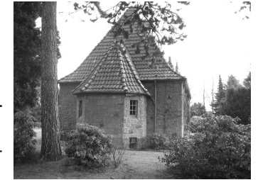
Blick auf die Rückseite der Kapelle

Früher wurden die Verstorbenen der Gemeinde Quelle auf dem Friedhof in Brackwede beigesetzt. Da dessen Vollbelegung um 1920 abzusehen war, mussten die an dem Begräbnisplatz beteiligten Gemeinden, so auch die Gemeinde Quelle, eigene kommunale Friedhöfe anlegen. Bereits im Juli 1920 erhielt die Gemein-