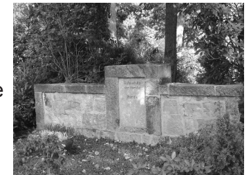
Altes Grabmal auf dem Friedhof Quelle

pflge auf dem Brackweder Friedhof für die Queller Einwohnerinnen und Einwohner mit einem hohen Kosten- und Zeitaufwand verknüpft waren. Am 23. Februar 1921 wurde der Friedhof Quelle eröffnet, von diesem Tag stammt auch die erste "Begräbnisordnung". Im Laufe der Jahre wurde der Friedhof nach und nach bis auf seine heutige Größe erweitert. Als Vorbild für die