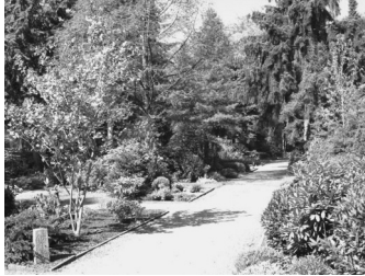
Eindrücke Friedhof Quelle

Der Friedhof wird in sechs Abteilungen unterteilt. Die Abteilung 2 umfasst den ältesten Friedhofsteil, dann folgen in chronologischer Reihenfolge die Abteilungen 3, 1 und 4. Neueren Datums sind die Abteilungen 5 und 6. Die Nummernsteine, die an den Grabstätten zu sehen sind, beziehen sich auf das "Abteilungssystem". Daneben existiert auf dem Friedhof