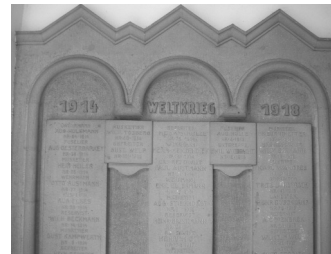
Sandsteintafel im Kapelleneingang zu Ehren von Kriegsgefallenen

Erwähnenswert sind die Sandsteintafeln im Eingang der Kapelle. Auf ihnen befinden sich die Namen von Gefallenen des Ersten Weltkrieges der Gemeinde Quelle.