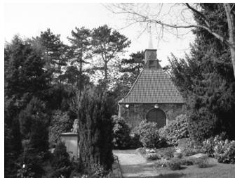
Blick auf die Friedhofskapelle

Der Friedhof Quelle erstreckt sich längs der Magdalenenstraße und wird im Westen durch das Siek des Lichtebachs begrenzt. Ein großzügig gestalteter Eingangsbereich lädt zum Betreten ein. Kurz danach werden Besucherinnen und Besucher von der kleinen, malerischen Friedhofskapelle in den Bann gezogen, die den gestalterischen Mittelpunkt der gesamten Anlage bildet. Geplant und erbaut wurde sie vom Architekten Ewald Krüger aus Bielefeld in den Jahren 1920 - 21.