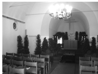
Innenansicht der Friedhofskapelle

noch die alte Einteilung in Felder. Da viele Grabstättenbesitzer nur die "alte Bezeichnung" ihrer Grabstätte kennen, wird diese Einteilung momentan noch nicht vollständig aufgegeben.