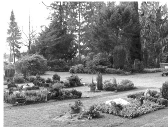
Urnenfeld auf dem Friedhof Quelle

Zurzeit werden auf dem Friedhof Quelle Erdwahlgräber, Erdreihengräber, Wahlgrabstätten für Urnenbestattung sowie Urnenrasenpfleregereihen- sowie Urnenrasenpfleregewahlgrabstätten angeboten.