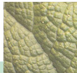
Gartenabfälle im Wald können das ökologische Gleichgewicht stören.

2. Die Bodenlebewesen können nur wenige Zentimeter der organischen Bodenaufgabe im Jahr zersetzen. Die aus Gartenabfällen bestehende zusätzliche Schicht aus organischem Material beeinträchtigt den Lufthaushalt des Bodens, was zu einer Verringerung der Aktivität der Bodenorganismen führt und den Zersetzungsprozess verlangsamt. Die Folge: Typische, heimische Waldbodenpflanzen (z.B. Buschwindröschen) und mit ihnen die auf diese Pflanzen spezialisierten Insekten werden auf Grund der veränderten Standortbedingungen verdrängt.