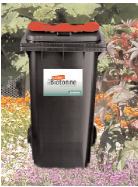
Die Saison-Biotonne ist für Gartenbesitzer eine ideale Ergänzung zur Kompostierung oder Biotonne.