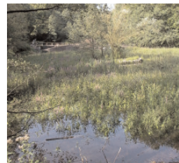
Helfen Sie mit die Natur zu erhalten!

Bei der Ablagerung von Gartenabfällen in der freien Landschaft oder in Parks und Grünanlagen handelt es sich um eine Ordnungswidrigkeit, die mit Bußgeldern bis zu 50.000 € geahndet werden kann.