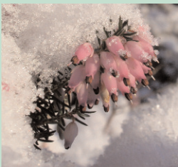
Stellen Sie die Biotonne im Winter frostgeschützt auf.