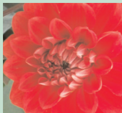
Aus Bio-Abfällen kann wertvolle Komposterde gewonnen werden.

Restmüll am besten im zugebundenen Abfallsack in die Restmülltonne geben.