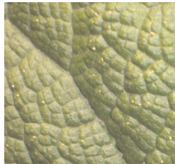
Bio-Abfälle bitte pur - ohne z. B. Papier- oder Plastikbeutel - in die Biotonne geben.

Den Sammelbehälter mit einfachem Zeitungspapier (keine Hochglanzbeilagen oder -magazine) auslegen.