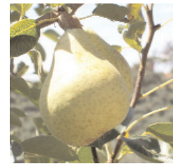
Einfaches Zeitungspapier hilft Feuchtigkeit aufzunehmen.