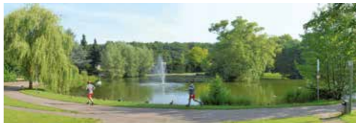
Grünzug am Bültmannshof

Naturerleben benötigt Wanderwege. Mehr als 520 Kilometer gekennzeichnete Wanderwege werden vom Teutoburger-Wald-Verein und den örtlichen Heimatvereinen betreut. Die Stadt Bielefeld unterstützt diese überwiegend ehrenamtliche Aufgabe, weil sie einen wertvollen Beitrag für die Idee StadtParkLandschaft darstellt.