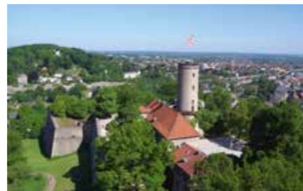
Sparrenburg und Johannisberg

Mit StadtParkLandschaft soll das Gebiet rund um die historisch und naturkundlich spannenden Orte Sparrenburg und Johannisberg zu einem unverwechselbaren Landschafts- und Erlebnispark entwickelt werden. Neben einer zeitgemäßen touristischen Weiterentwicklung der historischen Festung Burg Sparrenberg („Sparrenburg“) sollen bestehende Freizeitangebote rund um den Bielefelder Johannisberg besser vernetzt, und innovativ vermarktet werden. Der historischen Parkanlage auf dem Johannisberg wurde in den letzten Jahren durch gartendenkmalpflegerische Sanierung viel von ihrem alten Glanz zurückgegeben.