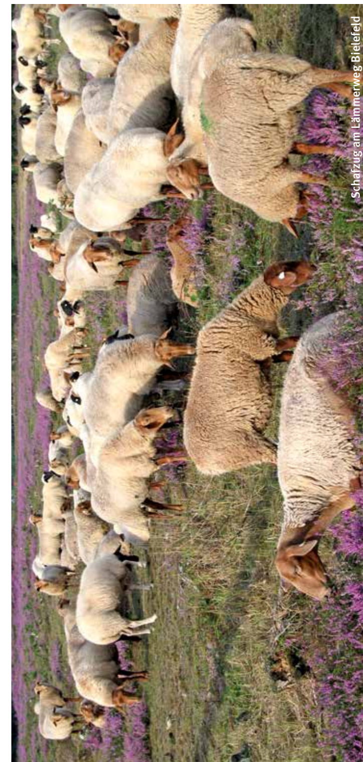
Schatzweg am Lämmerweg Bielefeld

Durch das nutzerorientierte Informationssystem können über eine interaktive Karte im Internet Touren zum Wandern, Radfahren, Joggen oder Walken ausgewählt, beliebig kombiniert und abgerufen werden. Das Portal bietet eine Fülle an Serviceleistungen, unter anderem Informationen über Sehenswürdigkeiten am Weg sowie Tipps für barrierefreie, wetterfeste und kindgerechte Einrichtungen. Die OstwestfalenLippe Marketing GmbH hat seit Ende 2009 den „TEUTO_Navigator“ für den gesamten Raum OWL realisiert. Für das Stadtgebiet von Bielefeld werden die Daten von Bielefeld Marketing mit Unterstützung des Umweltamtes laufend in dieses System eingepflegt. ( www.teutonavigator.com/de )