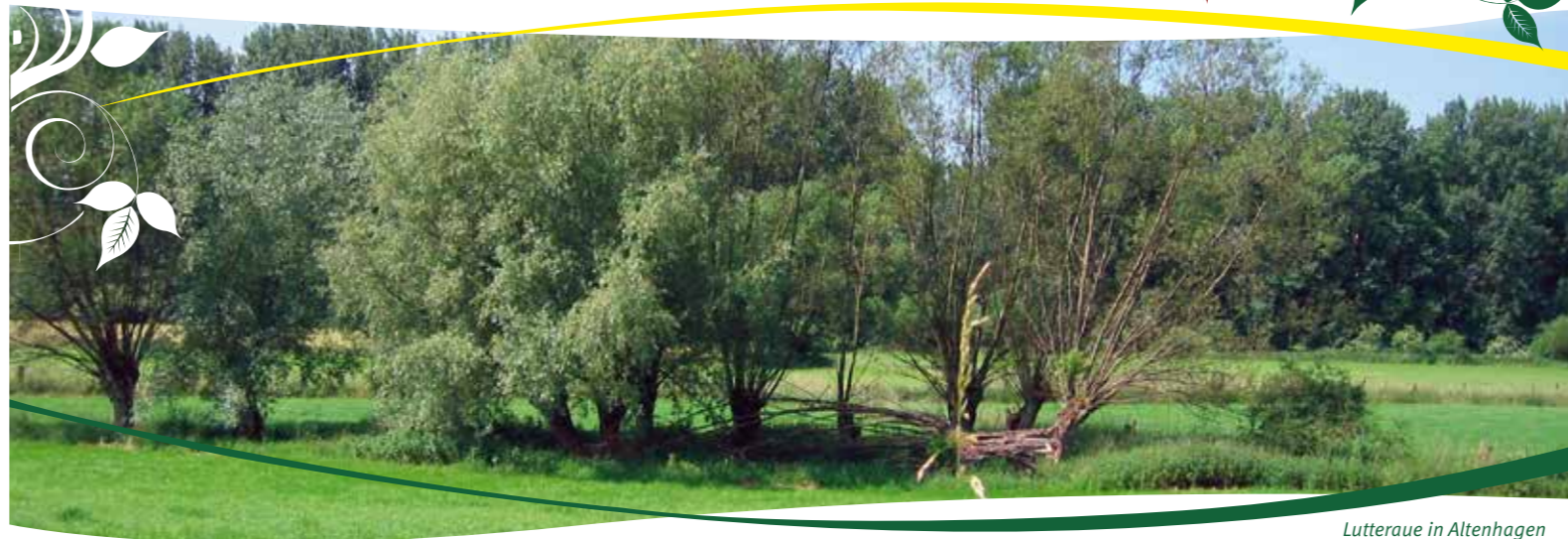
Lutteraue in Altenhagen