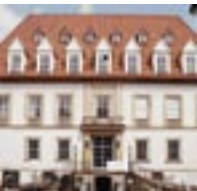
Theater am alten Markt

Der Wettbewerb der Städte und Regionen um die Zukunft hat schon begonnen. Um attraktiv zu sein, müssen Städte künftig mehr bieten als Arbeit und Wohnen. Kultur und Freizeit, Bildung und Unterstützung von Familien werden immer wichtigere Standortfaktoren. Um Ghettos zu vermeiden, wird eine gesunde Mischung von Generationen verschiedener Nationalitäten in den Stadtteilen immer wichtiger.