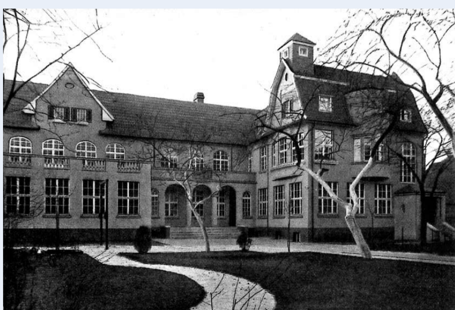
Vereinigte Wäschefabrik Juhl und Helmke

aus: Otto Warburg / J.W. van Someren Brand: Kulturpflanzen der Weltwirtschaft, Leipzig o.J.