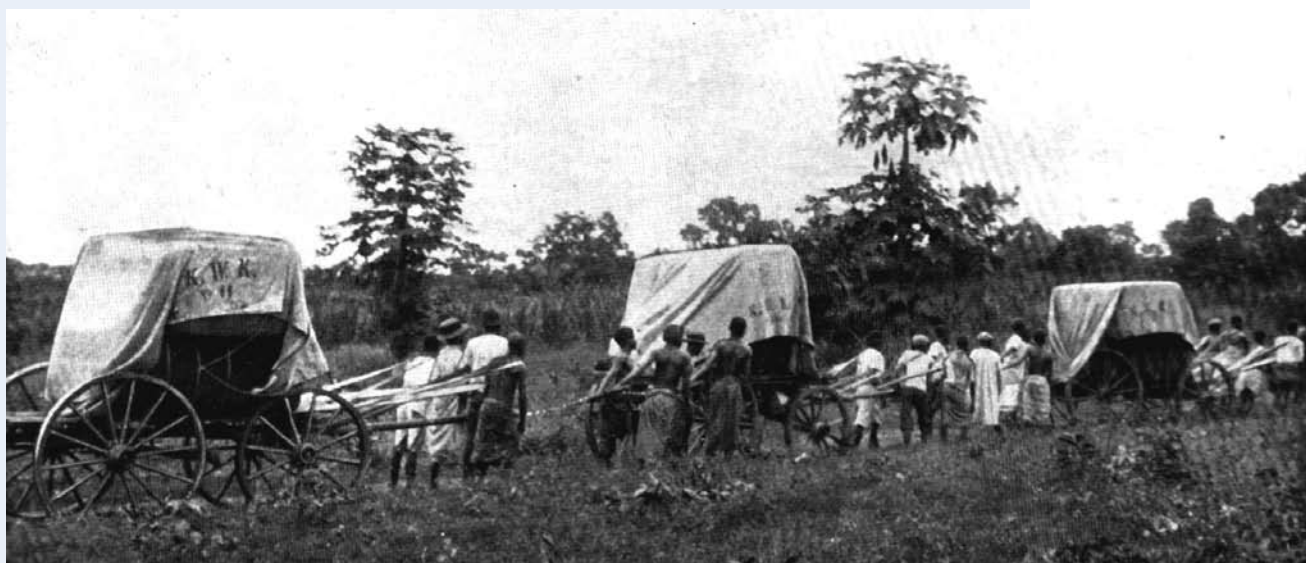
Baumwolltransport in Togo

In der Antike nannte man diese Pflanze „der Baum, der weiße Wolle trägt“.