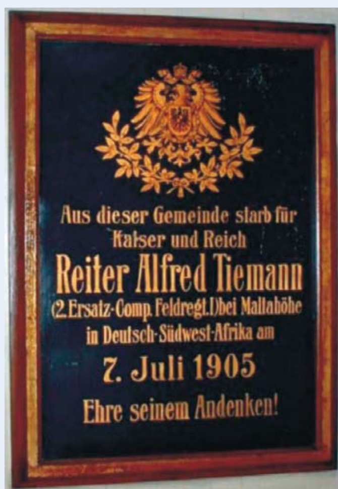
Gedenktafel in der Süsterkirche