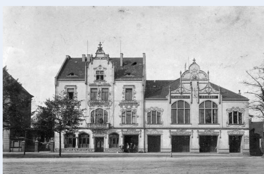
Kyffhäuser am Kesselbrink