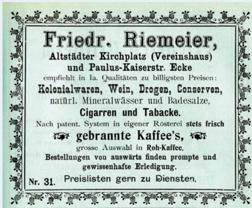
Anzeige aus dem Bielefelder Adressbuch 1900

Das Welthaus in der August-Bebel-Straße beschäftigt sich mit den bis heute sichtbaren Folgen des Kolonialismus.