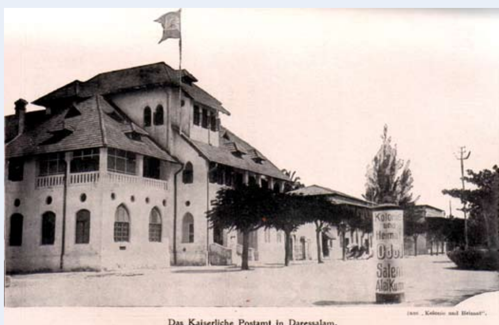
Das Kaiserliche Postamt in Darassalam.