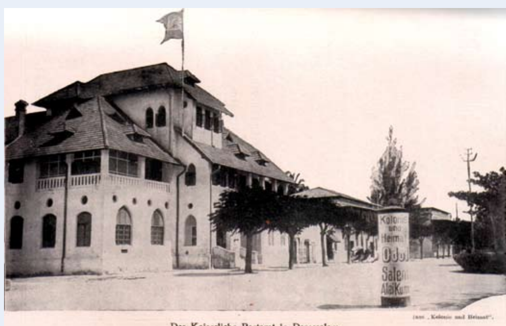
Das Kaiserliche Postamt in Darassalam.