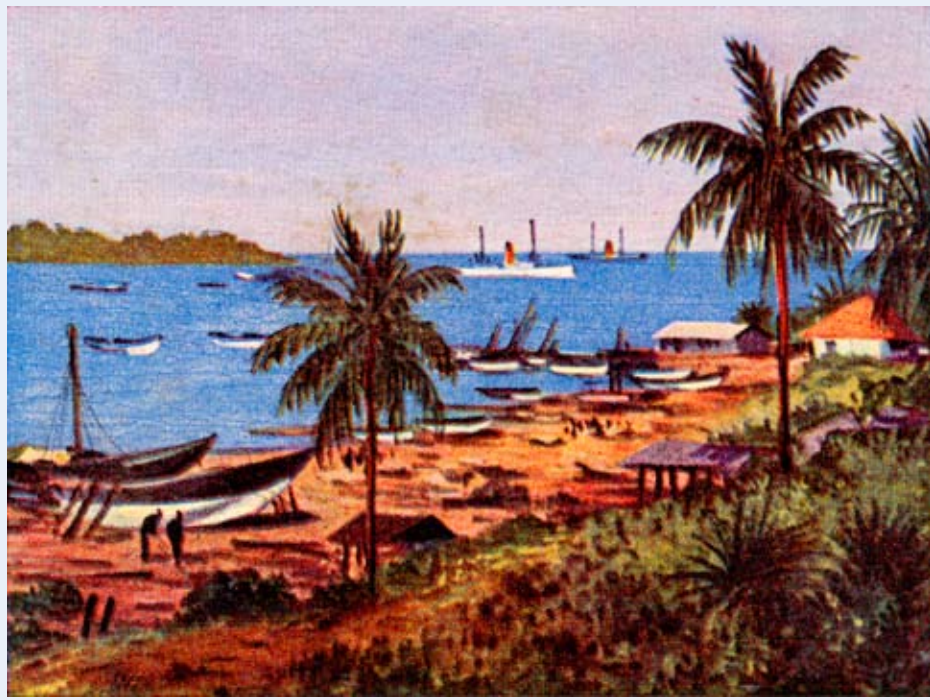
Hafen von Tanga, Deutsch-Ostafrika, Sammelbild 1936

Auszüge einer Rede, gehalten am 2. Dezember 1911 anlässlich des 25jährigen Bestehens der Abteilung London der Deutschen Kolonialgesellschaft, in: Zeitschrift für Kolonialpolitik, Kolonialrecht und Kolonialwirtschaft, Nr. 1, Januar 1912