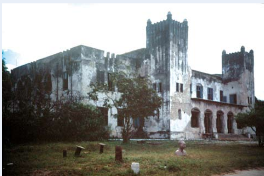
Gouverneurspalast von Deutsch-Ostafrika in Bagamoyo (Tansania)