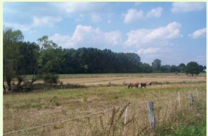
Lutteraue - östlich von Baumheide

Ich bin seit August 2000 im Bezirk Heepen in den Ortsteilen Baumheide, Milse und Brake als Landschaftswächter tätig. Mit den landschaftlichen Gegebenheiten in diesem Bereich und seinen Umweltproblemen war ich schon viele Jahre vorher vertraut. Ich habe im Rahmen der Arbeitsgemeinschaft Ornithologie des Naturwissenschaftlichen Vereins Bielefeld von 1986 bis 1988 in diesem Gebiet Kartierungsarbeiten für den Brutvogelatlas "Die Vögel Bielefelds" durchgeführt. In den 90er Jahren habe ich dort Amphibien kartiert. Meine damaligen Versuche, eine Vielzahl von Umweltproblemen in Form von wilden Müllkippen u.a. durch die zuständigen Ämter der Stadt beseitigen zu lassen, waren nicht so erfolgreich. Das hat sich nach meiner Bestellung zum Landschaftswächter grundlegend geändert. Jetzt besteht eine überaus gute Kooperation mit dem Umweltbetrieb, der städtischen Forstabteilung und dem Landesbetrieb Wald und Holz NRW/Forstamt Bielefeld.