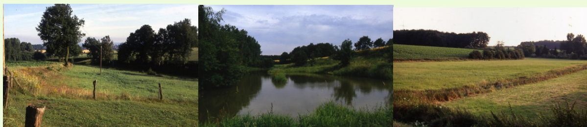
Fotografische Impressionen aus dem Naturschutzgebiet Moorbachtal in Jöllenbeck

Seit dem Erreichen meiner Freizeitphase der Altersteilzeit kann ich jetzt einen nützlichen Beitrag zum aktiven Umweltschutz leisten.