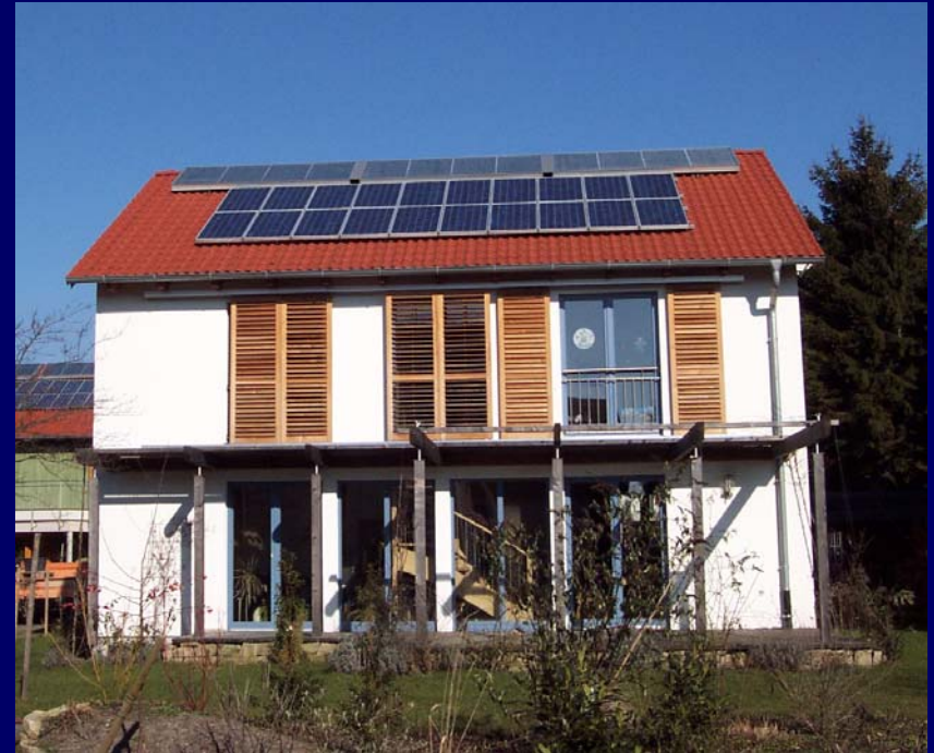
Einfamilienhaus Solarsiedlung - Holzbauweise