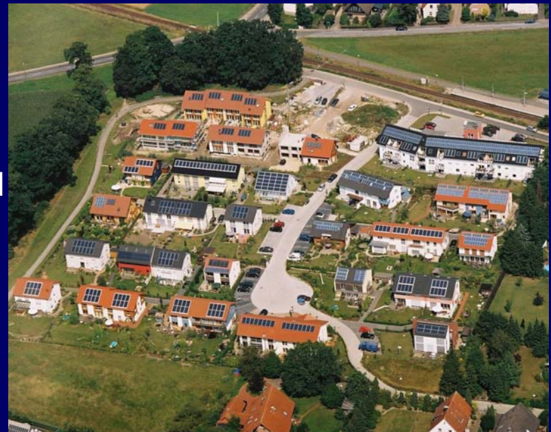
Luftbild Solarsiedlung Bielefeld Kupferheide August 2004