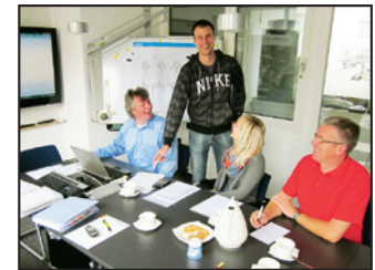
Sitzung des Umweltteams