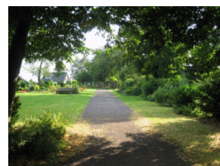
Querweg zwischen den Abteilungen 1 und 2

Die Ruhezeiten betragen auf dem Friedhof Vilsendorf für Bestattungen in Erdwahl- und Reihengrabstätten 30 Jahre, in Urnenwahlgrabstätten 20 Jahre und in Kinderreihengrabstätten 15 Jahre.