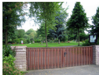
Haupteingang Friedhof Vilsendorf

Großzügig gestaltete Eingangsbereiche laden zum Betreten des Friedhofs ein. Eine junge Lindenallee bereichert die Anlage und gliedert diese. Auch lassen sich stattliche Laubgehölze wie z. B. schöne Hainbuchen entdecken. Der Friedhof wird von großen Wiesenflächen geprägt, die als Erweiterungsflächen für künftige neue Grabfelder bestimmt sind. Die in Nutzung befindlichen Grabflächen liegen in unmittelbarer Nachbarschaft zur Kirche, es handelt sich hierbei um die ältere Abteilung 1 und die jüngere Abteilung 2. Der Friedhof Vilsendorf hat keine eigene Friedhofskapelle.