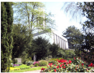
Blick auf die Epiphanienkirche

Der Friedhof Vilsendorf liegt im Stadtbezirk Jöllenbeck. Er ist einer der jüngsten und zugleich kleinsten der kommunalen Bielefelder Friedhöfe. Er liegt unmittelbar neben der Epiphanienkirche der evangelisch-lutherischen Kirchengemeinde Vilsendorf. Im Osten und Süden wird die Friedhofsanlage von Wohngebieten