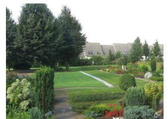
Blick über die beiden Reihenfelder

Auf dem Friedhof werden zurzeit Wahlgrabstätten für Erdbestattungen, Urnenwahlgrabstätten, Reihengrabstätten für Erdbestattungen und Kinderreihengrabstätten angeboten.