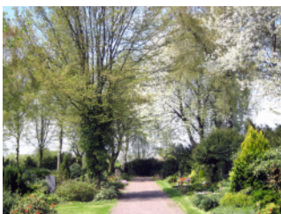
Abteilung 1 des Friedhofs Vilsendorf

1954 formulierte die Gemeindevertretung Vilsendorf die Notwendigkeit eines gemeindeeigenen Friedhofs, da die in der Gemeinde Verstorbenen auf dem Schildescher Friedhof beigesetzt werden mussten. Da sich die Verhandlungen zum Erwerb eines geeigneten Geländes schwierig gestalteten,