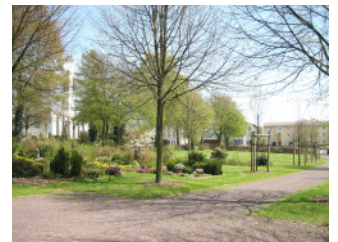
Blick auf die noch junge Lindenallee

Friedhof wurde am 17. Mai 1958 in einer Feierstunde eingeweiht. Bei seiner Gründung umfasste der Friedhof nur den südlichen Teil der heutigen Abteilung 1. Im Laufe der Jahre wurde der Friedhof Vilsendorf mehrfach erweitert. 1972 wurde der nördliche Teil der Abteilung 1 ausgebaut, 1989/90 Abteilung 2 sowie Teile der heutigen Erweiterungsflächen dazu erworben. Die Bestattungen konzentrieren sich heute auf Abteilung 1 sowie geringe Bereiche der Abteilung 2. Zuletzt wurde ein neuer Parkplatz angelegt.