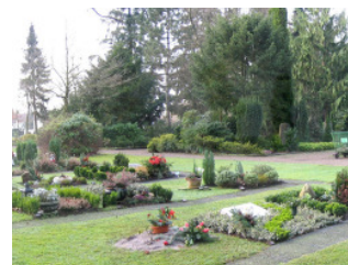
Urnenfeld auf dem Friedhof Quelle

Der Friedhof wird in sechs Abteilungen unterteilt. Die Abteilung 2 umfasst den ältesten Friedhofsteil, dann folgen in chronologischer Reihenfolge die Abteilungen 3, 1 und 4. Neueren Datums sind die Abteilungen 5 und 6. Die Nummernsteine, die an den Grabstätten zu sehen sind, beziehen sich auf das "Abteilungssystem". Daneben existiert auf dem Friedhof noch die alte Einteilung in Felder. Da viele Grabstättenbesitzer nur die "alte Bezeichnung" ihrer Grabstätte kennen, wird diese Einteilung momentan noch nicht vollständig aufgegeben.