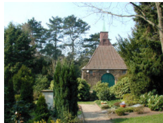
Übersicht mit Friedhofskapelle

Der Friedhof Quelle erstreckt sich längs der Magdalenenstraße und wird im Westen durch das Siek des Lichtebachs begrenzt. Ein großzügig gestalteter Eingangsbereich lädt zum Betreten ein. Kurz danach werden Besucherinnen und Besucher von der kleinen, malerischen Friedhofskapelle in den Bann gezogen, die den gestalterischen Mittelpunkt der gesamten Anlage bildet.