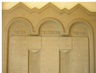
Sandsteintafel im Kapelleneingang zu Ehren von Kriegsgefallenen

Geplant und erbaut wurde sie vom Architekten Ewald Krüger aus Bielefeld in den Jahren 1920 - 21. Erwähnenswert sind die Sandsteintafeln im Eingang der Kapelle. Auf ihnen befinden sich die Namen von Gefallenen des Ersten Weltkrieges der Gemeinde Quelle.