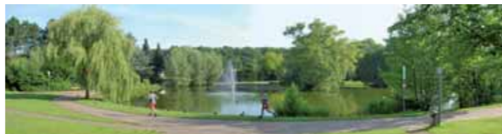
Grünzug am Bültmannshof

Naturerleben benötigt Wanderwege. Etwa 520 Kilometer gekennzeichnete Wanderwege werden vom Teutoburger-Wald-Verein und den örtlichen Heimatvereinen betreut. Das Umweltamt unterstützt diese überwiegend ehrenamtliche Aufgabe, weil sie einen wertvollen Beitrag für die Idee StadtParkLandschaft darstellt.