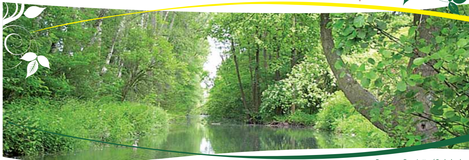
Zusammenfluss Lutter / Baderbach