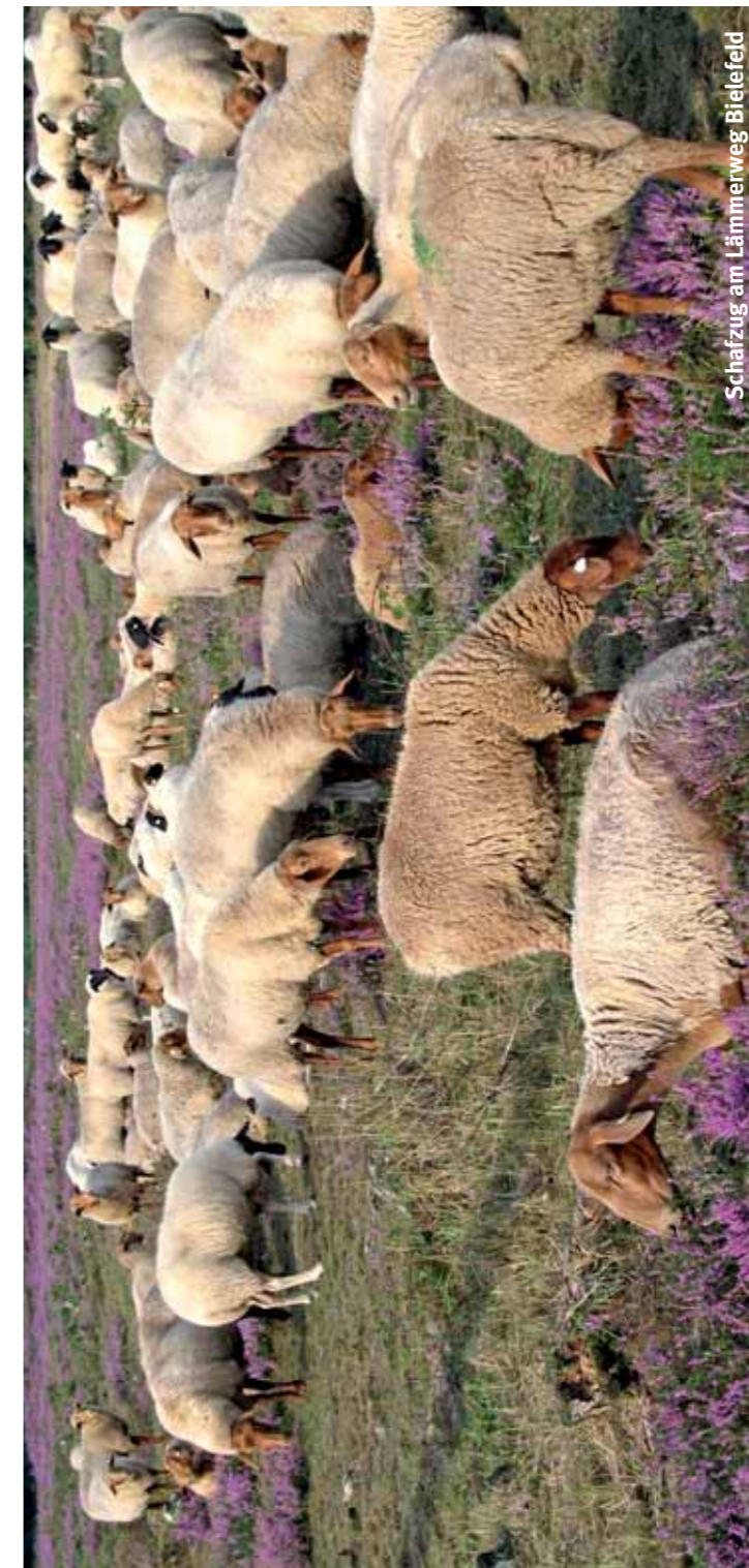
Schafzug am Lämmerweg Bielefeld

Bielefeld liegt an der Lutter, die in der Innenstadt leider nicht mehr erlebbar ist, weil sie vor etwa 100 Jahren verrohrt wurde. Das soll sich Dank der Initiative des Vereins Pro Lutter ändern. 2004 konnte bereits der erste kleine Bauabschnitt im Grünzug am Waldhof der Öffentlichkeit übergeben werden. Ein zweiter Abschnitt von 1,2 km Länge zwischen Teutoburger Str. und Stauteich I soll ab 2011 folgen, maßgeblich unterstützt durch Ideen von Schülerinnen und Schülern. Mit der Offenlegung der Lutter wird die Aufenthaltsqualität und der Erlebniswert der Grünanlage erheblich gesteigert. Und auch der Naturschutz profitiert durch neue Entfaltungsmöglichkeiten für wassergebundene Tiere und Pflanzen (weitere Informationen unter www.prolutter.de ).