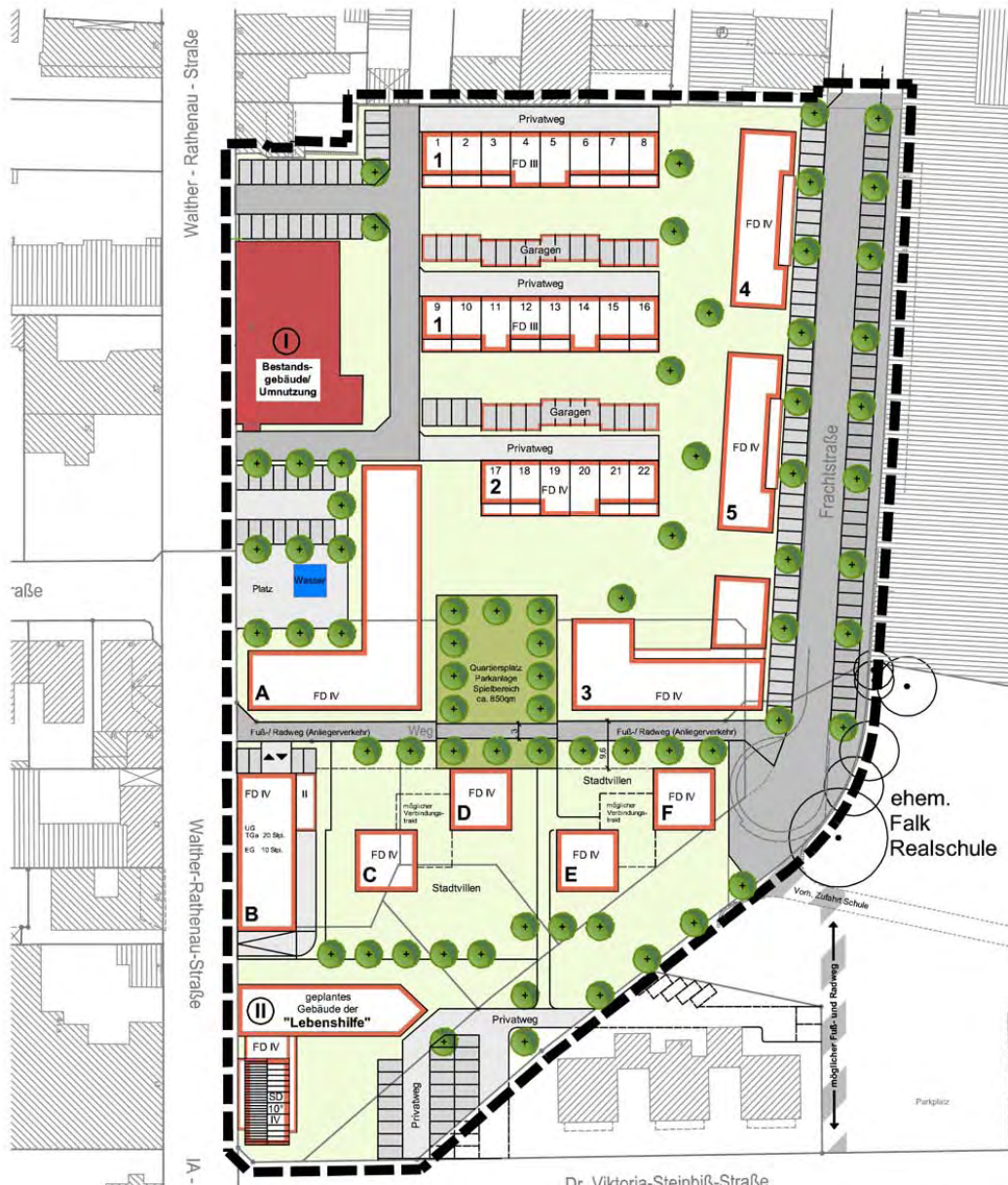
Der aktuelle B-Plan-Entwurf