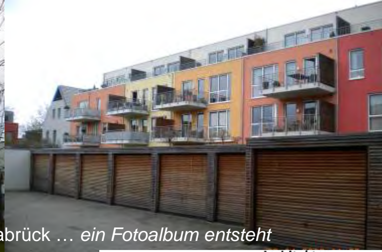
Gemeinsame Besichtigung von Bauinteressierten in Osnabrück ... ein Fotoalbum entsteht