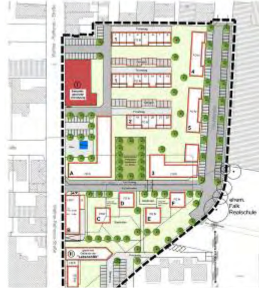
Variante 1: mit West/Ost-Durchquerung für den Verkehr