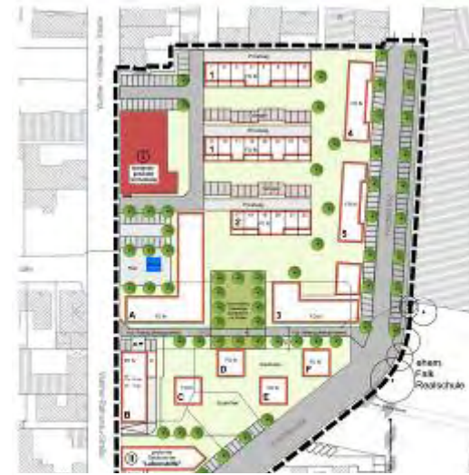
Variante 2: mit Beibehaltung der diagonal verlaufenden Frachtstraße