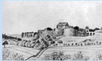
Ansicht van de Sparrenburg, tekening van Th. Walther 1828