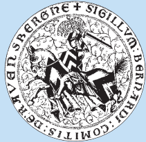
Schets van het ruiterzegel van graaf Bernard van Ravensberg

Ergens tussen 1240 en 1250 is de burcht gesticht op een rotswand, de Sparrenberg. In het jaar 1256 wordt de naam van de burcht voor het eerst vermeld in een oorkonde. Bouwheer graaf Ludwig van Ravensberg maakt van de burcht de residentie van de landsheer en zijn gevolg, en het bestuurscentrum van het graafschap. Ook garandeerde de vesting een veilige doorgang door het Teutoburger Woud en beschermde de pas gestichte stad Bielefeld (1214).