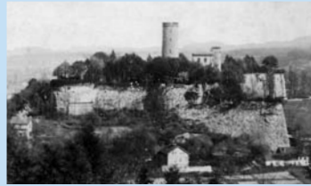
Vista al Castillo Sparrenburg aprox. en el año 1890

En el transcurso del tiempo el Castillo Sparrenburg ha tenido muchos dueños y regentes. En el año 1647, un año antes de la Paz Westfaliana, se terminó el conflicto de sucesión hereditaria de la Ciudad de Jülich-Kleve, mediante el Tratado de Düsseldorf.