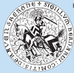
Reproducción del Sello del Jinetes del Conde Bernhard de Ravensberg

El Castillo fue construido supuestamente en el periodo de tiempo entre 1240 hasta 1250 en una colina de roca, que hoy se llama «Sparrenberg». En el año 1256 se lo menciona por primera vez documentariamente. Su constructor, El Conde Ludwig de Ravensberg, transformó el Castillo en el Centro de Gobierno de su Condado. Además era el domicilio para el Presidente Regional y su séquito. Al mismo tiempo servía para asegurar militarmente el puerto de montaña del Bosque de Teutoburg (Teutoburger Wald) y para proteger y custodiar la Ciudad de Bielefeld, fundada en 1214.