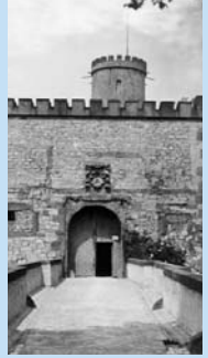
Portal de entrada al patio del Castillo (1890)

En el patio interior se encuentra el monumento del Gran Príncipe Elector que el Emperador Guillermo II, como último Conde de Ravensberg, le donó a la ciudad e inauguró en un acto solemne el 6 de agosto de 1900.