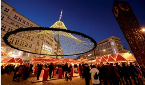
Weihnachtsmarkt auf dem Jahnplatz

Die ursprüngliche Wegegabel vor dem Niederntor ist seit 1932 der amtliche Ortsmittelpunkt Bielefelds. Seinen Namen erhielt der Platz von der Jahneiche, die 1861 von der Bielefelder Turngemeinde dort gepflanzt wurde. Im Jahnplatz-Forum, einer Einkaufspassage unter der Erde, befindet sich eine Büste des „Turnvaters“ Jahn (Richtung Bahnhofstraße). Auf dem Platz selbst ist die bronzefarbene Alcina-Uhr nicht zu übersehen. Diese war ein Geschenk der Firma Alcina Cosmetic an die Stadt Bielefeld anlässlich des 50-jährigen Firmenjubiläums im Jahr 1996.