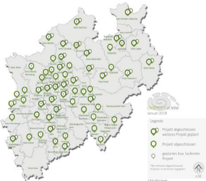
ÖKOPROFIT® Kommunen in NRW

ÖKOPROFIT® ist seit 20 Jahren erfolgreich und ebenfalls ein anerkanntes Energieeffizienznetzwerk im Rahmen der Initiative Energieeffizienz- Netzwerke der Bundesregierung.