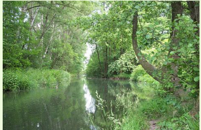
Zusammenfluss von Lutter und Baderbach im Heeperholz

Ich war von August 2000 bis März 2015 im Bezirk Heepen in den Ortsteilen Baumheide, Milse und Brake als Landschaftswächter tätig. Mit den landschaftlichen Gegebenheiten in diesem Bereich und seinen Umweltproblemen war ich schon viele Jahre vorher vertraut. Ich habe im Rahmen der Arbeitsgemeinschaft Ornithologie des Naturwissenschaftlichen Vereins Bielefeld von 1986 bis 1988 in diesem Gebiet Kartierungsarbeiten für den Brutvogelatlas "Die Vögel Bielefelds" durchgeführt. In den 90er Jahren habe ich dort Amphibien kartiert. Meine damaligen Versuche, eine Vielzahl von Umweltproblemen in Form von wilden Müllkippen u.a. durch die zuständigen Ämter der Stadt beseitigen zu lassen, waren nicht so erfolgreich. Das hat sich nach meiner Bestellung zum Landschaftswächter grundlegend geändert. Jetzt besteht eine überaus gute Kooperation mit dem Umweltbetrieb, der städtischen Forstabteilung und dem Landesbetrieb Wald und Holz NRW/Forstamt Bielefeld.