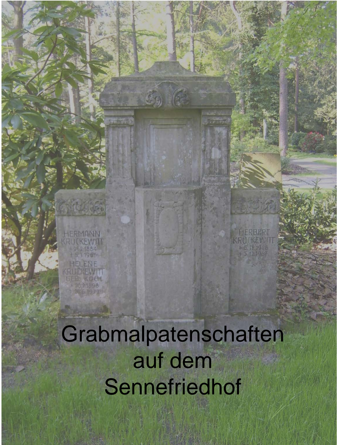
Grabmalpatenschaften auf dem Sennfriedhof