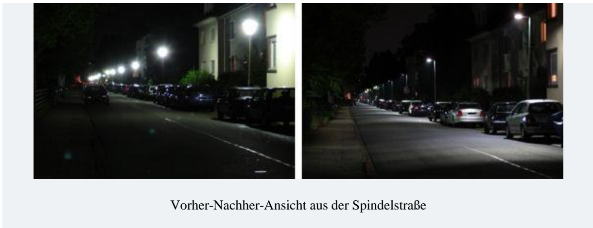
Vorher-Nachher-Ansicht aus der Spindelstraße

Die LED-Leuchten Typ VFL540 der Firma We-ef Leuchten GmbH & Co.KG (Bispingen), haben nur noch eine Leistungsaufnahme von 21 Watt (bei Schaltung von vier LED-Riegeln) gegenüber 89 Watt der bisherigen Pilz-Opalglas-Leuchten mit einer darüber hinaus deutlich verbesserten Ausleuchtung der Straßenflächen. Zur zusätzlichen Einsparung bei den CO 2 -Emissionen und den Energieverbräuchen wird die Leistung der Leuchten zwischen 22:30 und 04:30 Uhr noch einmal um zirka 50 Prozent (Schaltung von zwei LED-Riegeln) reduziert, wodurch sich eine mittlere Leistungsaufnahme von zirka 15 Watt ergibt. Die Einsparwerte betragen damit jeweils etwa 83 Prozent pro Leuchtkopf. Bereits bei Schaltung der halben Leistung von elf Watt (zwei LED-Riegel) zeichnet sich die LED-Leuchte mit bedeutend besseren Werten in der Beleuchtungsstärke (gemessen in Lux) gegenüber den herkömmlichen Pilz-Opalglasleuchten aus. Dadurch verbessert sich auch deutlich die Beleuchtungsstärke auf den Straßenflächen (Gehweg und Fahrbahn), wenn ein Leuchtenabstand von etwa 35 bis 40 Metern vorhanden ist, und die Gesamtbreite der Straße von etwa zehn Metern nicht überschritten wird.