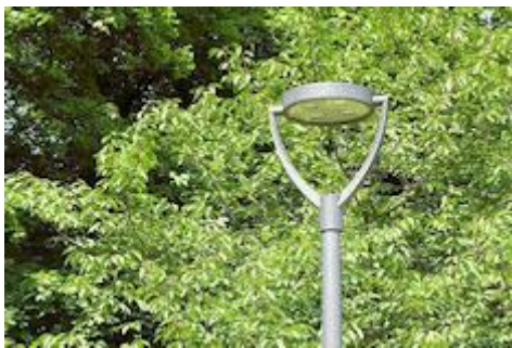
LED-Leuchte Trilux Publisca, Systemleistung 20 W

Der zweite Auftrag zum Einbau von Mastleuchten wurde wieder an die Firma Kraft- und Lichtanlagen GmbH (Herzfelde bei Berlin) erteilt. Zunächst wurden in Fortführung der Arbeiten des vorhergehenden Projektes noch 145 Stück Leuchten vom Typ VFL 540 mit einer Systemleistung von 29 Watt in Erschließungsstraßen montiert.