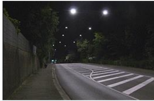
Alte Seil-Kofferleuchte, Systemleistung 137 W (links); Neue LED-Leuchte, Systemleistung 41 W

Der zweite Auftrag zum Einbau von Mastleuchten wurde wieder an die Firma Kraft- und Lichtanlagen GmbH (Herzfelde bei Berlin) erteilt. Zunächst wurden in Fortführung der Arbeiten des vorhergehenden Projektes noch 145 Stück Leuchten vom Typ VFL 540 mit einer Systemleistung von 29 Watt in Erschließungsstraßen montiert.