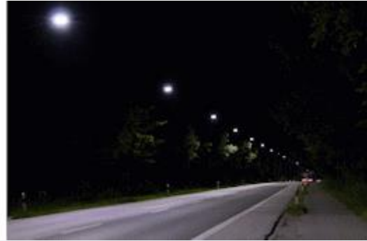
Alte Mast-Kofferleuchte, Systemleistung 137 W (li) Neue LED- Mast-Leuchte, Systemleistung 43 W

Um die einheitliche Ausleuchtung eines Streckenabschnitts zu erhalten, wurden auch im Zuge dieser Arbeiten 65 Seilleuchten und 126 Mastleuchten, die mit Natriumdampflampen (gelbes Licht) bestückt waren und auf Grund ihres Alters noch wieder verwendet werden konnten, abgebaut und an anderer Stelle wieder montiert.