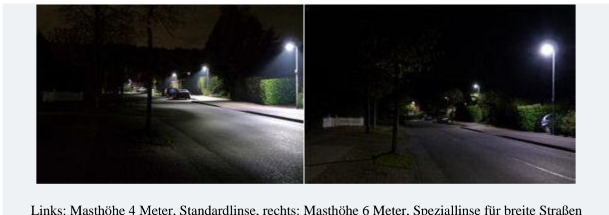
Links: Masthöhe 4 Meter, Standardlinse, rechts: Masthöhe 6 Meter, Speziallinse für breite Straßen

Durch die Aufstellung von höheren Masten in besonders breiten Straßen bzw. an Wendeplätzen kann zusätzlich in Verbindung mit der weiterentwickelten Linse die Ausleuchtung größerer Straßenflächen verbessert werden.