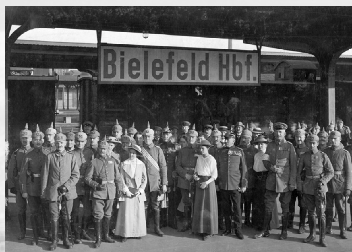
Offizierskorps des Infanterie-Regiments 55

Das Eintrittsgeld in Höhe von 10 Pfennig für Kinder und 25 Pfennig für Erwachsene floss in einen Fonds für die Hinterbliebenen von Gefallenen des Regiments 131. Zur Stärkung gab es im Anschluss Erbsensuppe aus der »Feldküche«.