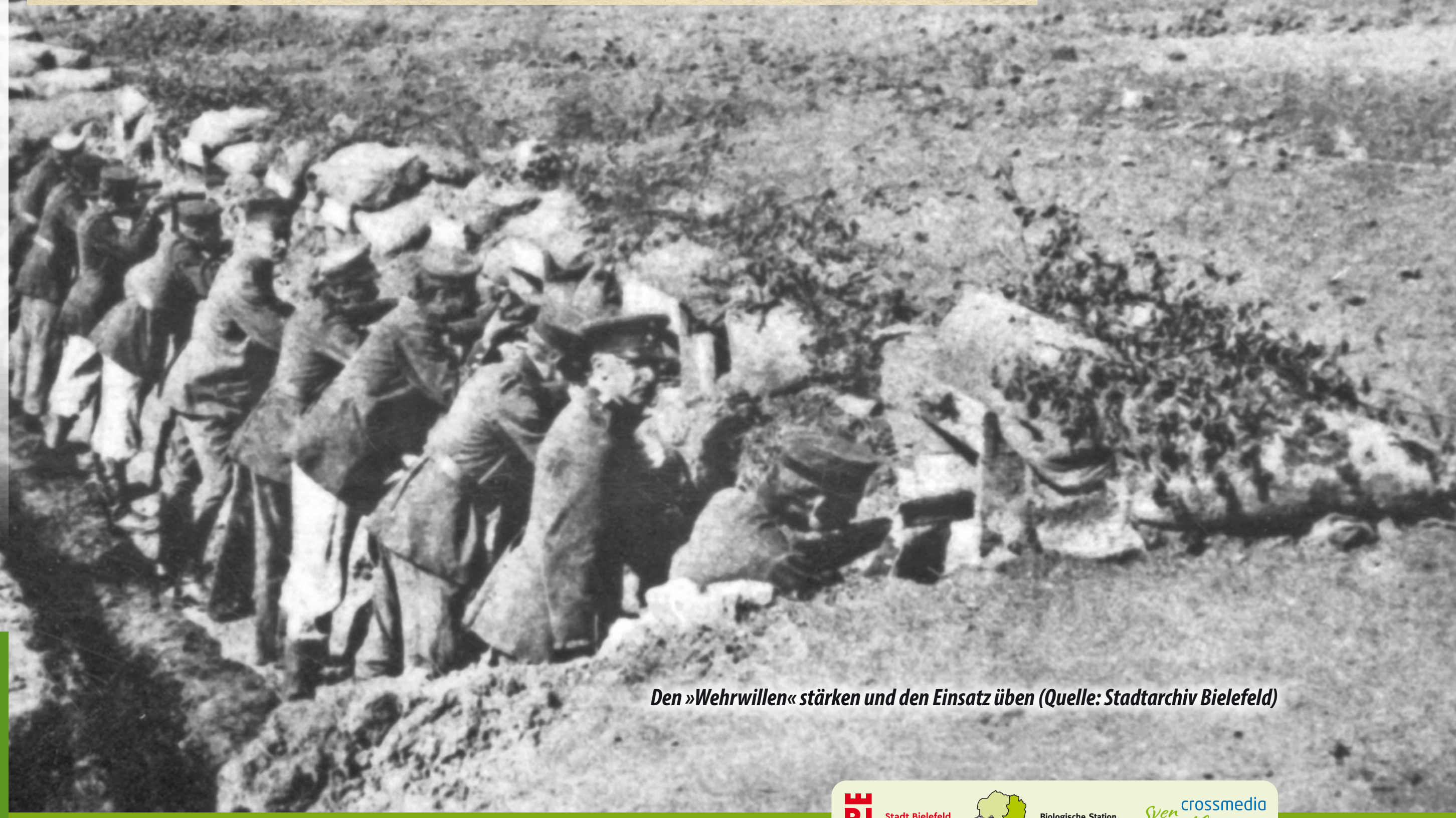
Den »Wehrwillen« stärken und den Einsatz üben