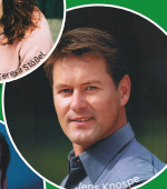
Jens Knospe © Jens Knospe