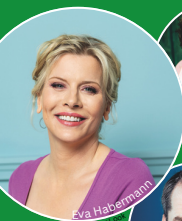
Eva Habermann © Oliver Look