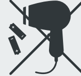
Elektro(-nik)-Geräte und Batterien* Electric/electronic devices and batteries* Elektronik cihazlar ve piller* · Электрические и электронные приборы, батарейки*