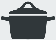
Töpfe und Pfannen Pots and pans · Tencere ve tava Кастроли, сковородки