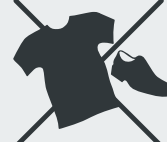
Altkleider und Schuhe Discarded clothing and shoes · Giyim ve ayakkabı · Старая одежда и обувь