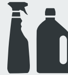
Verpackungen aus Kunststoff Plastic packaging material · Plastik ambalajı · Пластиковые упаковки