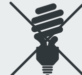
Energiesparlampen Energy-saving bulbs · Tasarruflu am- puller · Энергосберегающие лампы