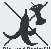
Bio- und Restmüll Residual waste · Organik ve artık çöpler Биологические и остальные бытовые отходы