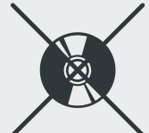
CDs / DVDs CDs / DVDs · CD / DVD Диски CD / DVD