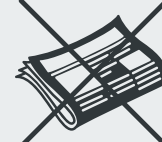
Pappe und Papierabfälle Waste cardboard and paper Karton ve kağıt atık · Картон, макулатура