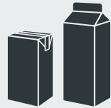
Tetrapacks Tetrapacks · Tetra pak Упаковки Тетра Пак