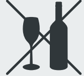
Glas Glass · Cam · Стекло