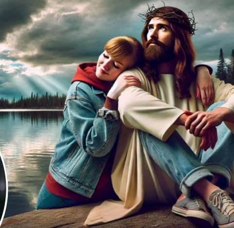
Foto: KI generiert

Vielleicht kennen Sie bereits das Buch oder den Film?