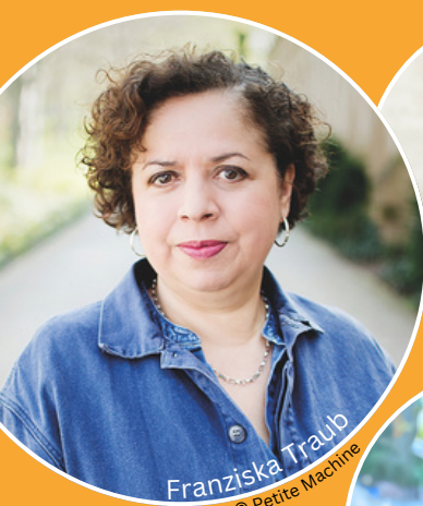
Franziska Traub © Petite Machine