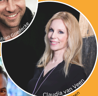
Claudia van Veen © Claudia van Veen