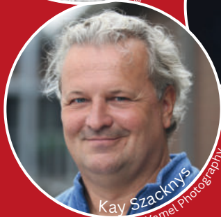
Kay Szacknys © Yarnel Photography