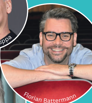
Florian Battermann