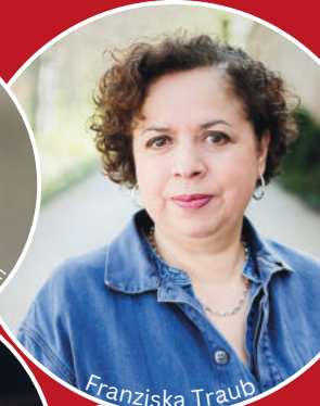
Franziska Traub © Petite Machine