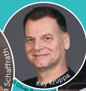
Kay Kruppa