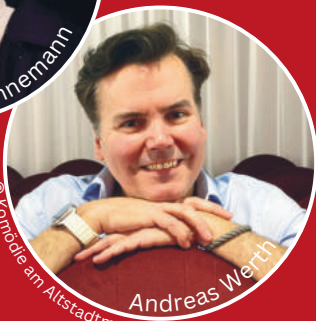
Andreas Werth © Komödie am Altstadtmarkt

Pierre Sanoussi-Bliss wurde einem breiten Publikum vor allem durch seine Rolle als Kommissar Axel Richter in der ZDF-Krimireihe Der Alte (1997–2015) bekannt. Zudem war er in zahlreichen Film- und Fernsehproduktionen zu sehen, darunter Doris Dörries preisgekrönte Komödie Keiner liebt mich . 2025 sorgte er mit dem zweiten Platz im RTL Dschungelcamp erneut für große mediale Aufmerksamkeit. Nun ist er wieder live auf der Bühne zu erleben.